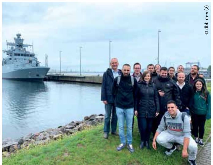
> Marinestützpunkt „Hohe Düne“ in Warnemünde.