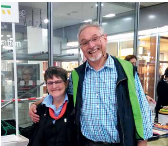
> Am Erfurter Hauptbahnhof informierte die GDL Reisende und dankte dem Zugpersonal für die tägliche Arbeit.

Den ehrenamtlichen Standbetreuer(innen) des 24. Septembers gilt großer Respekt und Anerkennung. Zahlreiche Helfer hatten sich extra für diesen Tag Urlaub genommen, um dabeizusein und zu helfen.