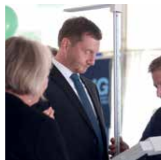
> Am Stand des BTE lässt sich Ministerpräsident Michael Kretschmer vermessen.

Alles in allem war der Tag der Sachsen 2019 wieder eine groß- artige Veranstaltung und ein voller Erfolg für den SBB, seine Gewerkschaften und unsere Gäste. Vielen Dank Euch allen!