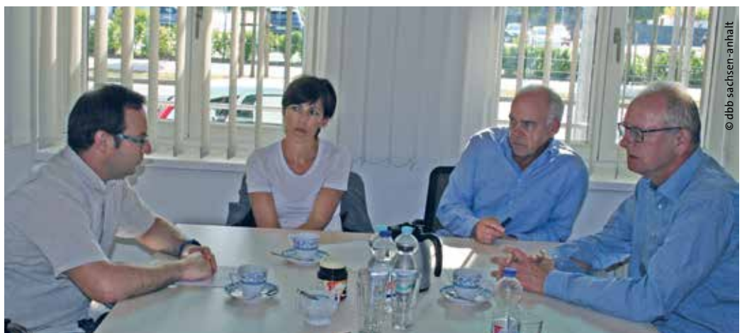
> Gewerkschafter diskutieren über die Auswirkungen des Gesetzes gegen illegale Beschäftigung und Sozialleistungsmisbrauch.

Nach einem intensiven Meinungsaustausch vereinbarten die beteiligten Gewerkschaften für das weitere Vorgehen eine Leitlinie zu erarbeiten. Alle Teilnehmer begrüßten das gewerkschaftsübergreifende Gespräch und vereinbarten eine weitere intensive Zusammenarbeit. Die Leitlinie soll auf der nächsten Hauptvorstandssitzung des dbb sachsen-anhalt vorgestellt werden. ■