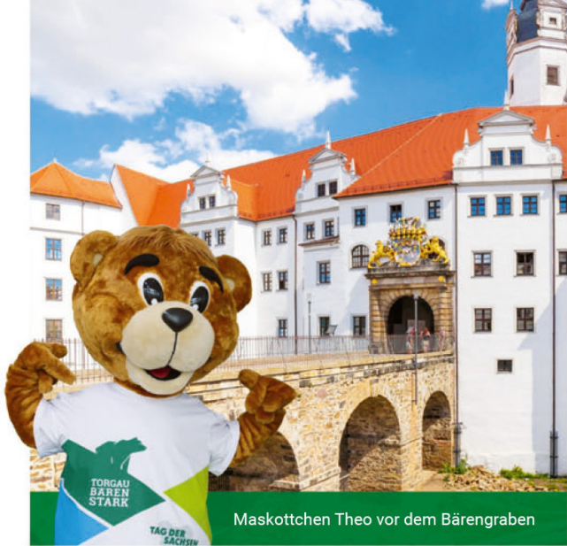
Maskottchen Theo vor dem Bärengraben