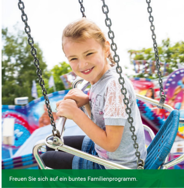
Freuen Sie sich auf ein buntes Familienprogramm.