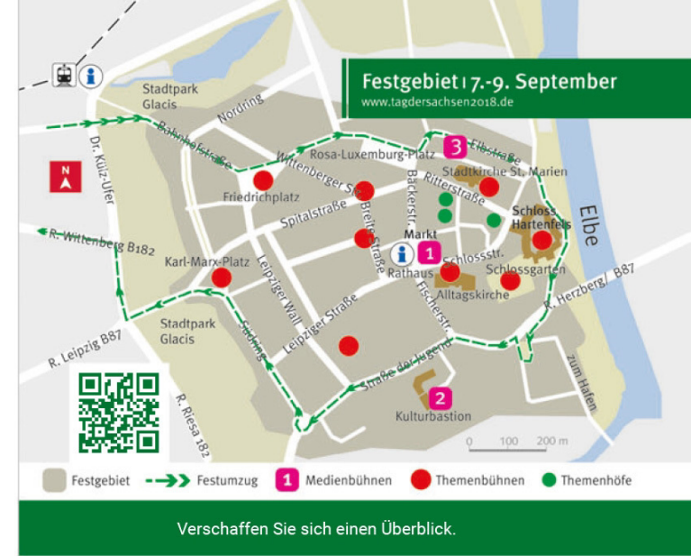
Verschaffen Sie sich einen Überblick.